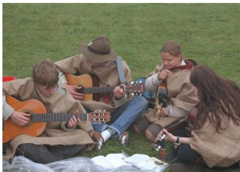
Für Lager und Fahrten,

Um pfadfinderisches Leben zu verwirklichen, benötigen wir finanzielle Mittel.