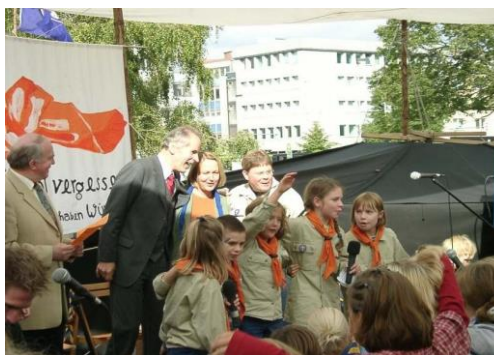
Für Projekte und Aktionen